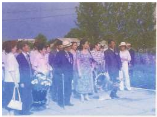
Зерделі кеңес аясында «Ер есімі-ел есінде» даңқ ескеркішіне гүл шоғын қою сәті.

Мерген ауылында «Кітапханаларды модернизациялау кітапхана ісіндегі жаңашылдықты дамыту» атты облыстық зерделі кеңес өтті.