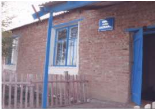
Самал ауылдық кітапханасы мектеп ғимаратының 25 кв.м көлеміне орналасқан.

1940 жылдар шамасында білім беру бөлімінің қарауында Барановка бастауыш мектебі ашылды. Ол кездегі саясатқа байланысты мектеп жанынан мектеп оқушыларына, ауыл тұрғындарына насихат жұмыстарын жүргізу үшін «Оқырман отауы» қызмет істеді. Ол кезде кітапханашылар өз қызметін мектептердегі оқу тәрбие жұмыстарымен қатар «Еліміздің коммунизмге бірте-бірте өту жолдарын белгілеп берген» партияның ХІХ съезд шешімдерімен тығыз ұштастыра отырып жұмысын жүргізді.