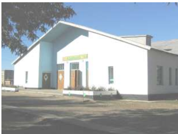
Бударин ауылдық кітапханасы мәдениет үйі ғимаратының 42 кв.м көлеміне орналасқан.

Аудан ішіндегі көпшілік кітапханалар сияқты Бударин ауылында да алғашқы кітапхана 1930 жылдары білім бөлімінің қарауында Бударин орталау мектебінің жанынан «оқырман отауы» болып ашылды. Ол кезде кітапхананың басты қызметі ауылдағы сауатсыздықпен күрес болды, осындай бағытта қызмет түрлерін жоспарлап, дауыстап оқу түрлерін ұйымдастырып отырды.