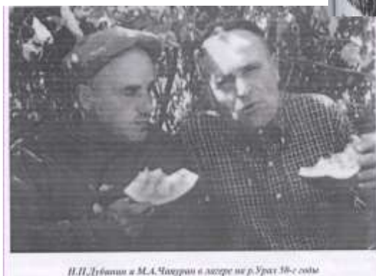
Н.Н.Дубинин и М.А.Чокоран в лагере на р.Урал 30-е годы

Сол сияқты осы ауылға бүкіл ғаламшарға белгілі оқымысты, академик А.Н.Дубинин ізін салған.