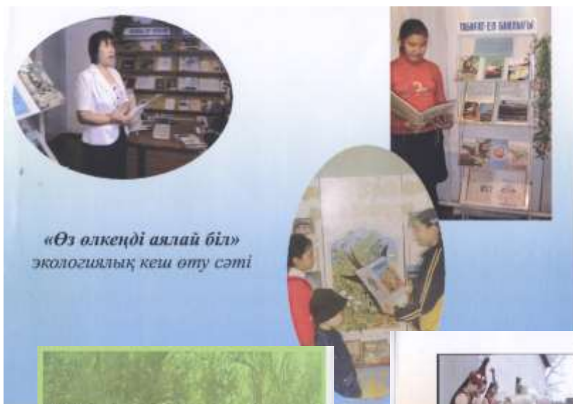
«Өз өлкеңді аялай біл» экологиялық кеш өту сәті